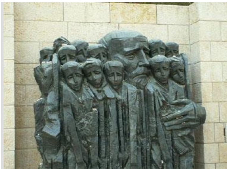
Памятник Янушу Корчаку в Яд-ва-шем, Иерусалим.