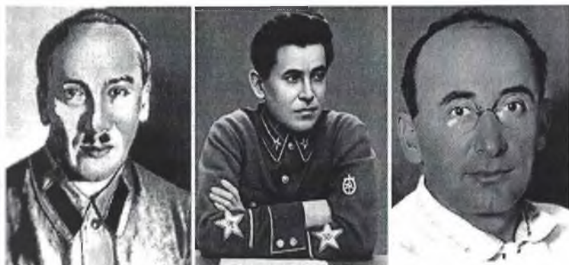
Слева направо: Г.Г. Ягода (1891—1938) возглавлял НКВД в 1934—1936 годах, Н.И. Ежов (1895—1940) возглавлял НКВД в 1936—1938 годах, Л.П. Берия (1899—1953) возглавлял НКВД в 1938—1945 годах

Причиной этого явилось постановление, принятое в ноябре 1938 г. Пленумом ЦК ВКП(б), осуждавшее ошибки парторганизаций при исключении коммунистов из партии и формально-бюрократическое отношение к апелляциям исключенных. Осуждались кляузники, карьеристы, создававшие в партии атмосферу недоверия и подозрительности. Упоминались работники НКВД, прокуратуры и судебных органов, которые пошли на их поводу, допустив «ошибки» в осуждении честных коммунистов. В постановлении говорилось также, что в органы НКВД «проникли враги народа», желающие вывести их из-под контроля партии. За этим политическим маневром, безусловно, скрывалось желание Сталина переложить всю ответственность за массовый террор на чекистов и персонально на Ежова. Поразительно, что Ежов это понимал. И его близкие тоже. По тайной договоренности с обезумевшей от ожидания женой, нарком сделал ей контрольный звонок — без слов, отправляясь на заседание Политбюро, где ему надлежало выслушать партийный приговор. Телефонная линия, конечно, прослушивалась. Жена все поняла и приняла смертельную дозу люминала. 24 ноября 1938 года Ежов был отстранен от руководства НКВД, затем арестован, а несколько месяцев спустя расстрелян в условиях строжайшей секретности. На его место был назначен другой сталинский ставленник — Л.П. Берия.