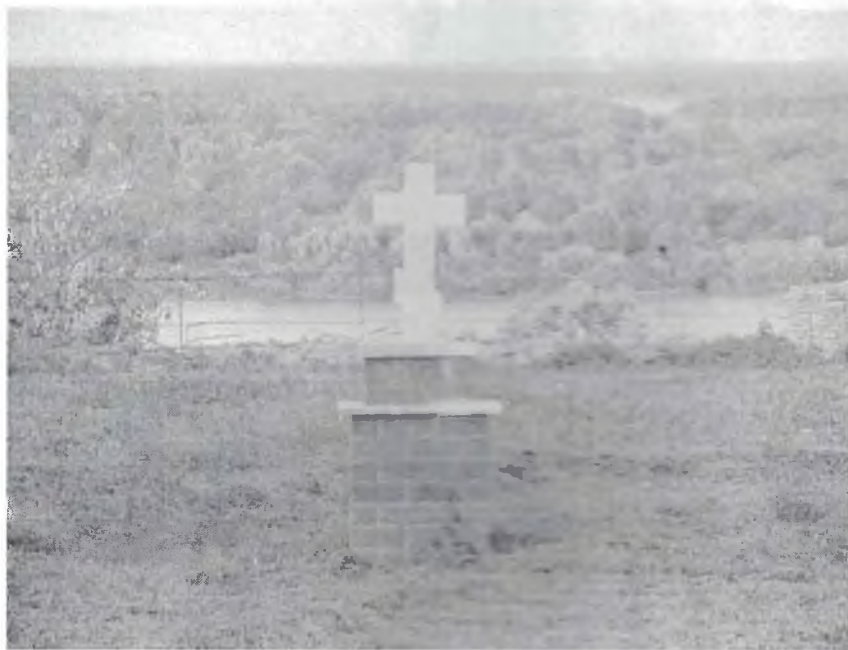
Крест в память репрессированных монахов в Спасском монастыре в г. Муром Владимирской области.