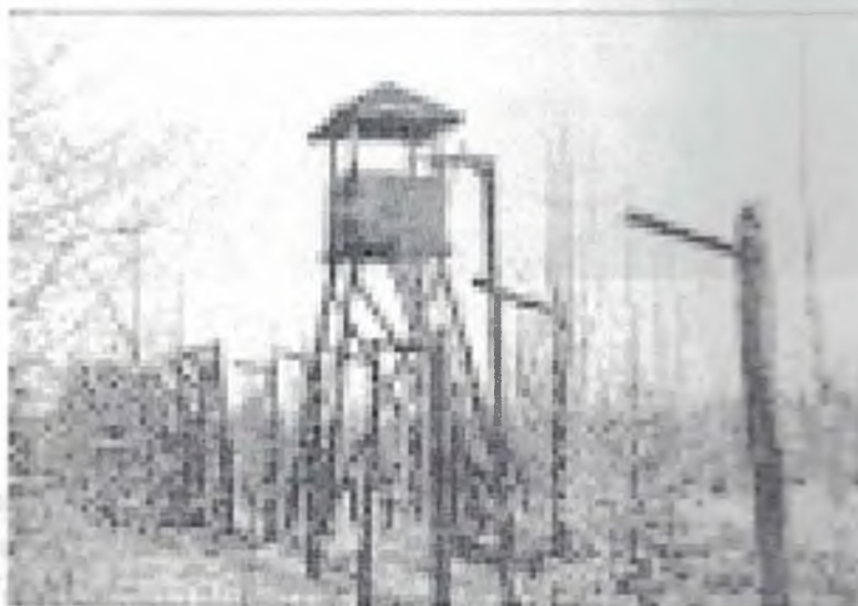
Лагерная вышка в одной из тюрем ГУЛАГа