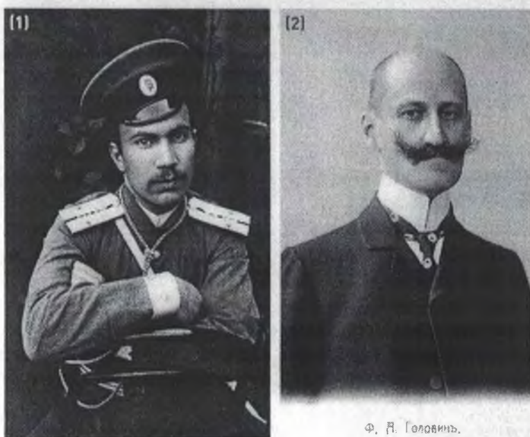
Жертвами печально известных «троек» среди многих стали расстрелянные на Бутовском полигоне один из первых русских летчиков, учитель прославленного Нестерова Н.Н. Данилевский [1] и Председатель 2-й Государственной думы Ф.А. Головин [2].

В Московском управлении КГБ хранятся одиннадцать томов с актами о приведении в исполнение смертных приговоров: с 7 августа 1937 года по 19 октября 1938 года в Бутове было расстреляно 20 765 человек. А ученые, проводившие раскопки на одном из массовых захоронений, оценив ту плотность, с которой лежали останки погибших, заявили, что на Бутовском полигоне может покоем лежать и 50 тысяч человек. «Иногда в сутки расстреливали до двухсот человек, — продолжает отец Кирилл. — А 28 февраля 1938 года здесь погибло 562 человека». В Бутовской земле лежит Федор Головин, председатель Второй Государственной думы, генерал-губернатор Москвы Владимир Джунковский, митрополит Ленинградский Серафим (Чичагов), один из первых русских летчиков Николай Данилевский, художники Александр Древин, Роман Семашкевич, Владимир Тимирев, старики и совсем молодые люди, множество представителей духовенства. Комментируя бесстрастную статистику, отец Кирилл поясняет: «Около трехсот человек из расстрелянных на полигоне причислены Русской православной церковью к лику святых. Такого места больше нет на русской земле».