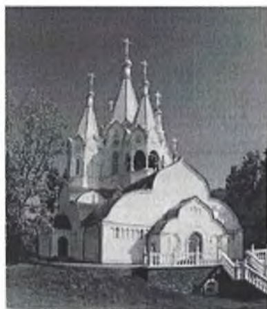
Храм Новомучеников и Исповедников Российских в Бутово

В этом году в Бутовском мемориальном комплексе было завершено строительство православного храма, а также установлен 12-метровый Большой Поклонный крест, который специально был доставлен сюда крестным ходом из Соловецкого Спасо-Преображенского монастыря.