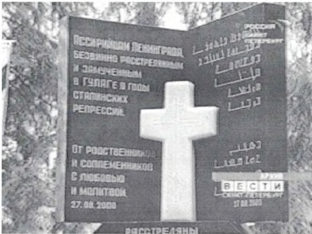
Мемориал на Левашовской пустоши под Петербургом, где покоятся около 40 тысяч жертв ГУЛАГа.