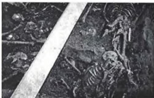
Результаты раскопок на Бутовском полигоне

Приговор приведен в исполнение.... К 1937 году тюрьмы перестали справляться с потоком казней, и «органы» выделили под эту задачу ряд специальных мест. В реестре «Некрополь ГУЛАГа», составленном обществом «Мемориал», — около 800 мест казней и массовых захоронений, разбросанных по стране. Это и полигоны типа подмосковных Бутова или «Коммунарки», и расстрельные рвы, и братские могилы, где тайно закапывали казненных, тысячи кладбищ при лагерях и спецпоселениях. Большинство давно разрушены и слились с землей, а иногда и вовсе были устроены на месте свалок, как Бутово. Занимающий два квадратных километра Бутовский полигон , недаром названный «Русской Голгофой», —