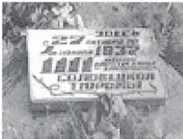
Мемориальная плита в память жертвам Соловецкой тюрьмы